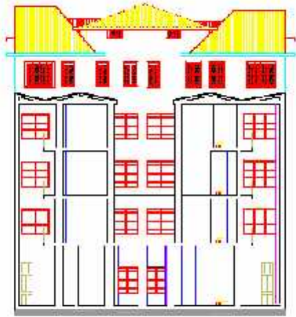
CORTE FACIADA D-E